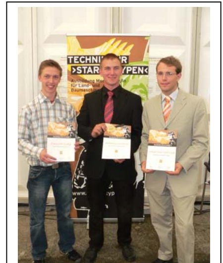
Wer folgt den sympathischen Bundessiegern 2009? Die Auflösung gibt es auf dem „2. Branchenkongress MOTORGERÄTE“ am 18./19. September in Raum Nürnberg. Vorschlagsberechtigt sind auch alle Mitglieder